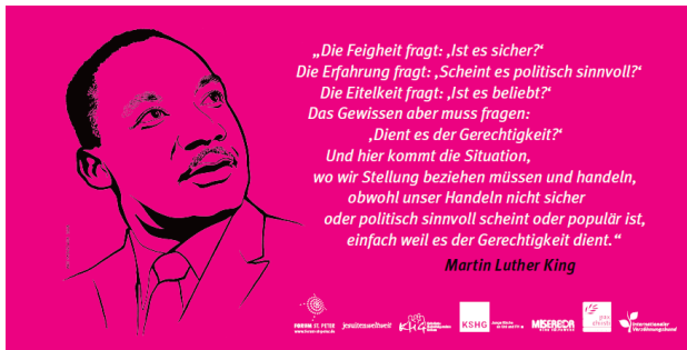
Ausstellungsplakat Dr. M. L. King

In Zeiten zunehmender politischer Spannungen, Polarisierungen und Drohgebärden soll mit der Ausstellung „Friedensstifter*innen“ an Personen erinnert werden, die einen gewaltfreien Weg gegangen sind. Menschen wie Mahatma Gandhi oder Martin Luther King sind international bekannt und stehen für Gerechtigkeit und gesellschaftliche Veränderungen, die sie ohne Waffengewalt vorangetrieben haben.